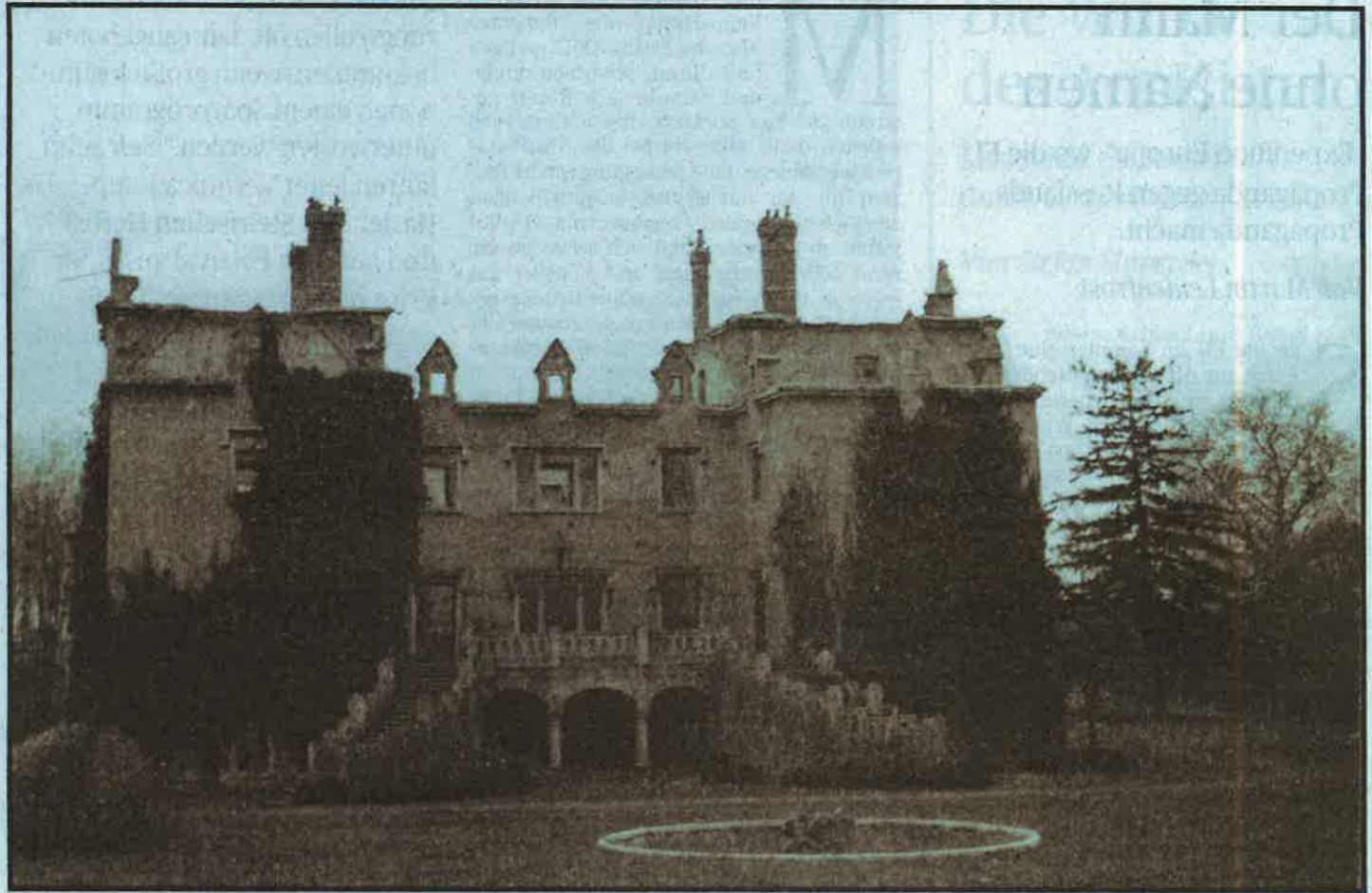
Das verbrannte Schloss Immendorf: Die Klimt-Gemälde waren in der Bel Etage gelagert, das Feuer begann in den Türmen.

Von 1939 bis 1942 erstellten Archivisten eine Inventarliste und mit ihr übereinstimmende „Aquirierungs“-Karten der Lederer-Sammlung. Jedes Gemälde war mit einer Nummer bezeichnet, derselben auf der Liste wie auf den Karten, die Bilder wurden fotografiert. Diese Quellen dokumentieren zehn Klimt-Gemälde mit den Nummern 102 bis 111 (ausgenommen „Beethovenfries“). Vor 1938